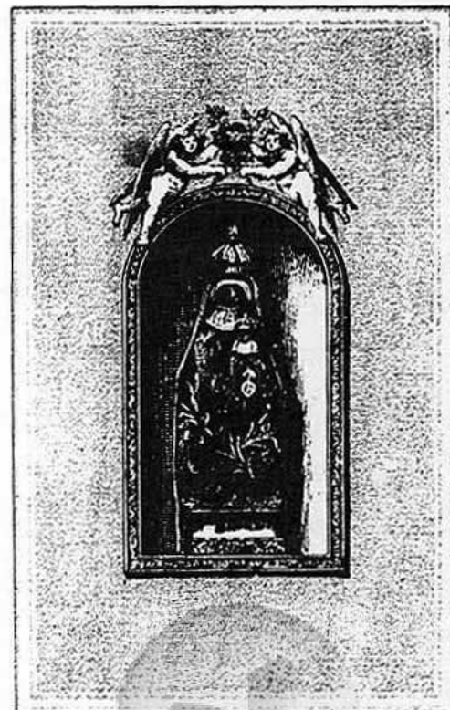
STATUE MIRACULEUSE DE N-D DE MARCELLE

restauration de la statue vénérée dans sa niche d'or. On vit, au rapport de plusieurs témoins, un nombre prodigieux de pèlerins accourir de toutes parts avec enthousiasme à Notre-Dame de Limoux. Il leur était enfin donné, après des temps si malheureux, de respirer le parfum qui s'exhale, dans ce vénérable sanctuaire, des autels de Marie, et d'épanouir leurs âmes aux douces influences de la piété. Ils étaient tout heureux de revoir ce sourire inexprimable de la Vierge, cette multitude d' ex-oto , de bâtons, de béquilles, de figurines en cire ou en argent, représentant des membres miraculeusement guéris. Tous ces objets, qu'ils retrouvaient appendus aux murs sacrés, comme autant de monuments des faveurs accordées à leurs pères par la bonne Vierge, ranimaient leur confiance en elle, et leur faisaient espérer qu'ils auraient part, eux aussi, à ses inépuisables bienfaits.